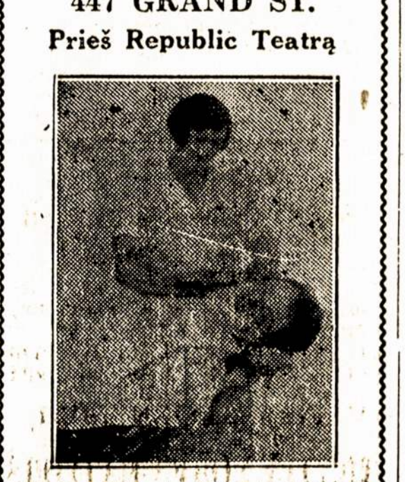
Tai puikiausia įtaisyta lietuviška "barberne" ir "Beauty Parlor" Brooklyne. Moksliniai patarnauja nu moderniškoms mašinoms, sėnitariskai užlaikoma, kainos labai žemos.

BEAUTY PARLOR Kuris pirma buvo 578 Grand St., Brooklyn, N. Y., dabar yra perkeltas ant 447 GRAND ST. Prieš Republic Teatrą