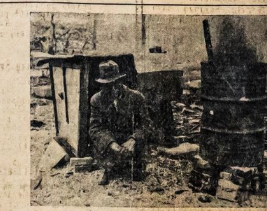
Jungtinėse Valstijose yra veik 17,000,000 bedarbių. Šimtai tūkstančių išmesti iš namų. Štai darbininkas gyvena būdoje, kurią jis pasidarė iš lentgalių. Kovo 4 d. nusintar demonstruoklime už bedarbių reikalus.

Pirmojo vietoj, kur randasi miestų kuopelės, imsis už iniciatyvos. Kur komunistų kuopelių nėra, ten turi dirbti mūsų progresyvių organizacijų kuopos ir "Meno" Sąjungos Chorai. Tų organizacijų privalumas darbą išplėsti iki augščiausio laipsnio, įtraukiant viso-