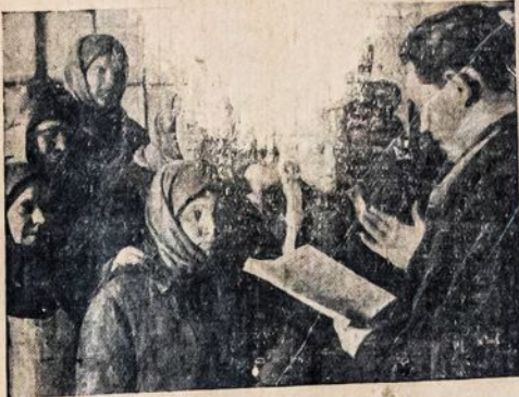
Sovietų Sąjungoje valstietėms duodama pamoka apie auklėjimą vaikų ir kitas jų pareigas, kaipo motinų ir darbininkų.

dėtį. Bet tas juos pastato veidas veidas su kitais imperialistais ir grūmoja užliepsnoti pasaulinis karas.