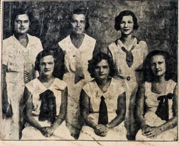
Aido Choro Merginų Sekstetas iš Brooklyn, N. Y.

Subatoj, 25 d. Vasario (February), 1933 LIETUVIŲ SVETAINEJE 243 N. Front St., New Haven, Conn. 7:30 VAL VAKARE. ĮZANGA 40c