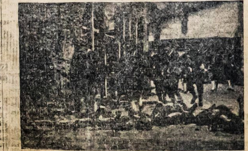
Japonijos imperialistai eina per chinų lavonus