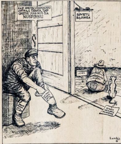
Sovietų Sąjunga jau baigė Pirmą Penkių Metų Planą. Dabar pradėjo antrą. Užbaigus jį, bus pilnai apsirūpinus ir išnaikins kapitalizmo likučius.

Peiping. — Bernard Shaw sako, kad Chinijos liaudies išsigelbėjimas tai komunizme.