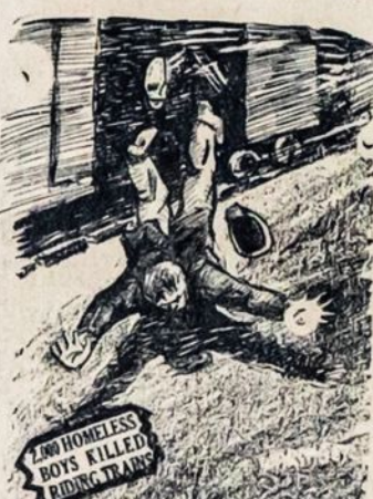
Stayed at a mission three days in New York and now is heading

We wait for another ride. A bunch of other young fellows are also waiting on the road. One of them is just a kid, going on 17. Father and mother dead for four years. Ran away from a "goddamned" orphane.