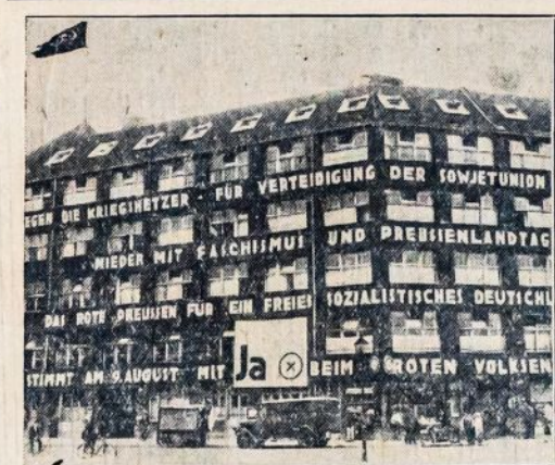
Vokietijos Revoliucinio Judėjimo Centras—Kro- Liebknechto Namas. Jame Randasi Komunistų Buveinė, Komunistų Dienraštis "Rote Fahne" ir daug kitų Organizacijų. Fašistai buvo surengę demonstracijas prieš šį namą, kad išdraskytų komunistų įstaigą, bet buvo atmušti. Dabartiniu laiku prie šio namo eina griežtos kovos tarpe fašistų ir komunistų.

Finlandijos generolas, kuris vadovavo "baltagvardiešų" spaudoje buvo rašyta, "čiū" armijai ir liejo kraudį, kad iš Finlandijos eina gandai, būk Sovietų Sąjunga prieš imperialistus, tai yra ruošiasi karui prieš Finlandiją. Dabartiniu laiku tos žinios pasiekė tikrąjį tikslą.