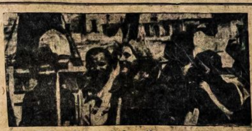
Prie Baku aliejaus industrijos moterys udarninkės.