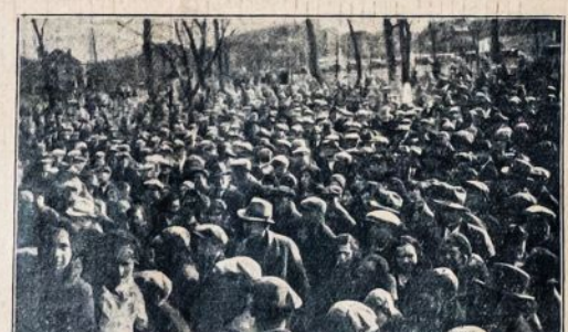
Kanadoje Alkanųjų Maršavimo Susirinkimas Hamiltono mieste, sausio 14 d., 1933. Dalyvauja 6,000 darbininkų

Darbininkai, kurie streikuoja, gerai laikosi. Pikieto eilės stiprios. Streikas dar vis plečiasi.