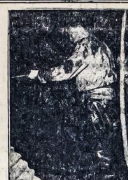
Vienas iš šimtų: Maskvės darbininkas kasa suvėję 100 pėdų gilumo po žeme.

Draugai ir draugės, neužmirškite sausio-January 28 d., šeštadienio vakaro. Nes tą vakarą Aido Choras rengia pirmutinį šmet balių, ir balius turėtų būt vienas iš didžiausių. Choro palaikymas nemažai atsieina, o choras visur darbininkams pata, nauja, kur tik būna užkviestas užpildyti programą. Tad choras mums visiems yra tikrai svarbus; todėl visi dalyvausime šiame jo parengime; pasidarykime tikrais choro rėmėjais. Todėl, draugai ir draugės, tikimės, kad visi pasimatysime Aido Choro baliuje, kuris įvyks po num. 325 East Market St., Crystal Ball Room, Wilkes Barre, Pa. Įžanga tik