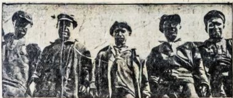
Sovietų Sąjungos angliakasiai—darbo smarkuoliai.

Tie vandens rezervai, kurie pasidarė užtvankai pasistatius, taipgi labai naudingi derlingai Ukrainai delei dirbtinio laistymo (irigacijos) laukų. Ukraina—duonos centras Sovietų Sąjungoj, tad geriau užtikrintas derlius, kuomet galės naudoti dirbtinį laistymą.