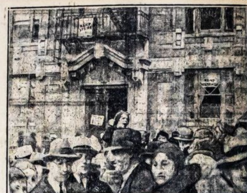
Nuomininkų (randauninkų) streikas Bronxe, N. Y. Kalbėtoja ragina randauninkus laikytis streiko lauke.