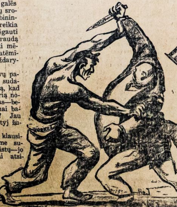
DAINUOS AIDO CHORAS, Vadovaujamas B. Šalinaitės

Valandos: nuo 1 iki 8 po pietų ir nuo 6 iki 8 vakare Telefonas, Midwood 3-6261