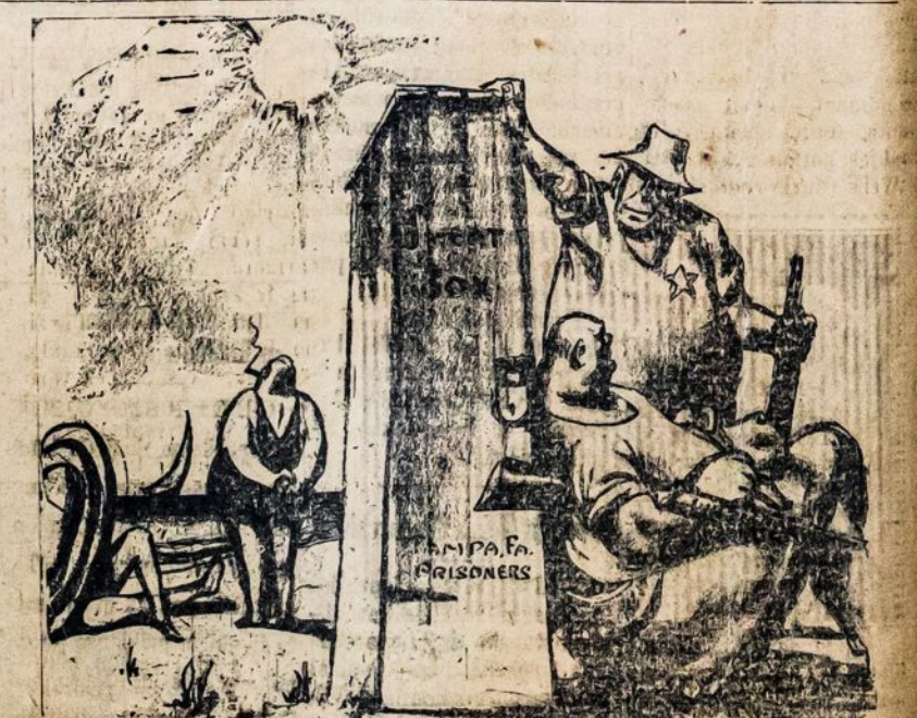
Sweat Box, Floridos kalėjimų įrankis kankinimui kalinių. Paveikslas parodo buržuaziją jaukiai besimaudantią, o sargus besaugojančius Prakitavimo Skryniją.