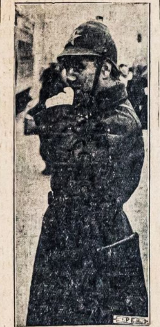
Vienas iš Maskvos, SSSR, komunikacijos trafiko palaikytojų.