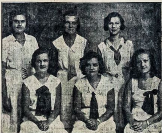
Aido Choro Merginų Sekstetas