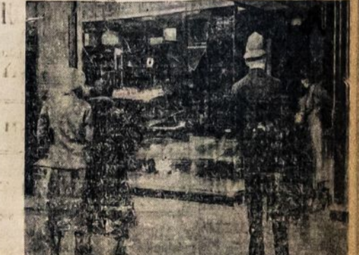
Donokėpykla Londone, kur 100,000 Alkanų Bedarbių Reikalavo Maisto. MacDonaldo Policijai Saugo Donokėpyklą nuo Alkanų Darbininkų. Amerikos Bedarbiai taipgi Maršuoja į Washingtoną Reikalauti Maisto ir Pastogės, o taipgi Socialiūs Apraudos.

Užmokėjimo algų įstatymai draudžia sulaukymą algų iki kontrakto pabaigos. Ir darbdavys netur teisės sulaukyti nors dalį darbininko algos, jeigu darbininkas sulaužo kontrakta.