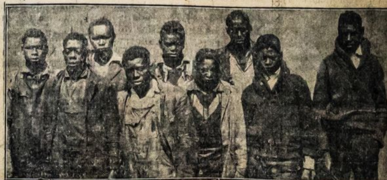
Scottsboro Jaunuoliai, Kurie Buvo Nus merkti Mirti, bet Kurie Pasaulio Darbininkų Masinė Kova Iškovojau Naują Teismą.