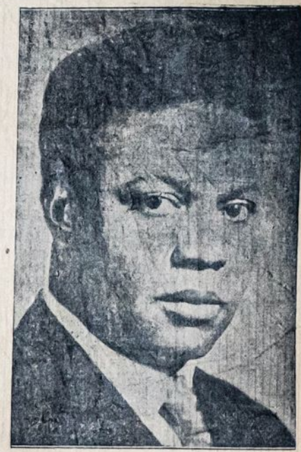
JAMES W. FORD Komunistų Partijos Kandidatas į Jungtinių Valstijų Vice-Prezidentus