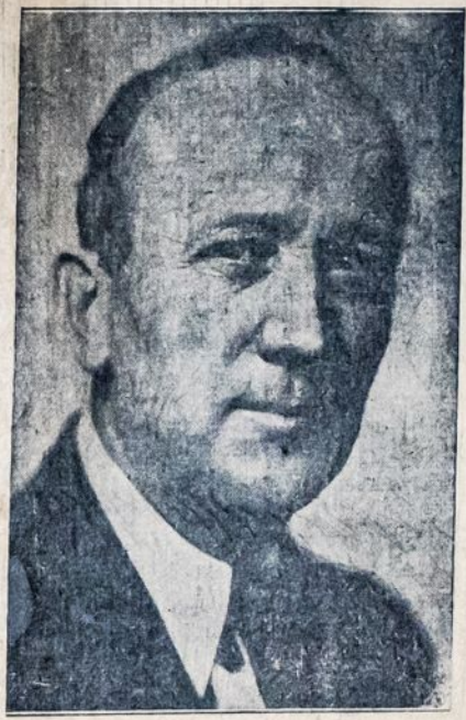
WILLIAM Z. FOSTER Komunistų Partijos Kandidatas į Jungtinių Valstijų Prezidentus