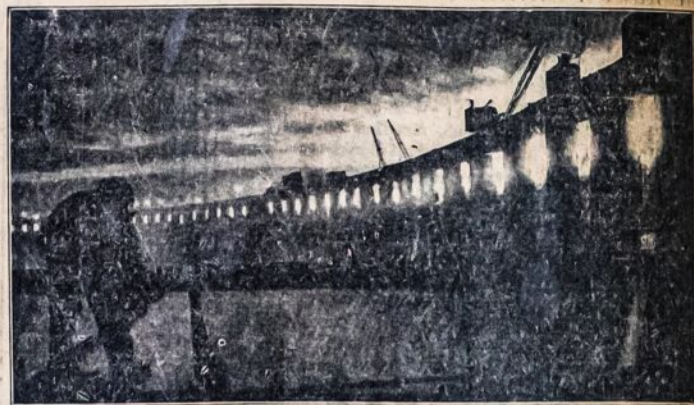
Dnieprostrojaus Užtvanka Naktį

Tolydžio kiekvienas komunistas, kiekvienas sąmoningas darbininkas privalo juo labiau stiprinti pačią Partiją, revoliucines darbo unijas, partijinę spaudą—"Laisvė", "Vilni", "Daily Worker"—ir visas darbininkų organizacijas. Šis darbas privalo būti tęsiamas visu atsidejimu. Tegyvuoją Sovietų Sąjungą!