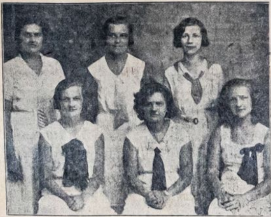
AIDO CHORO MERGINŲ SEKSTETAS, kuris išsimokino puikų vaidinimą su dainom, šiam koncertui