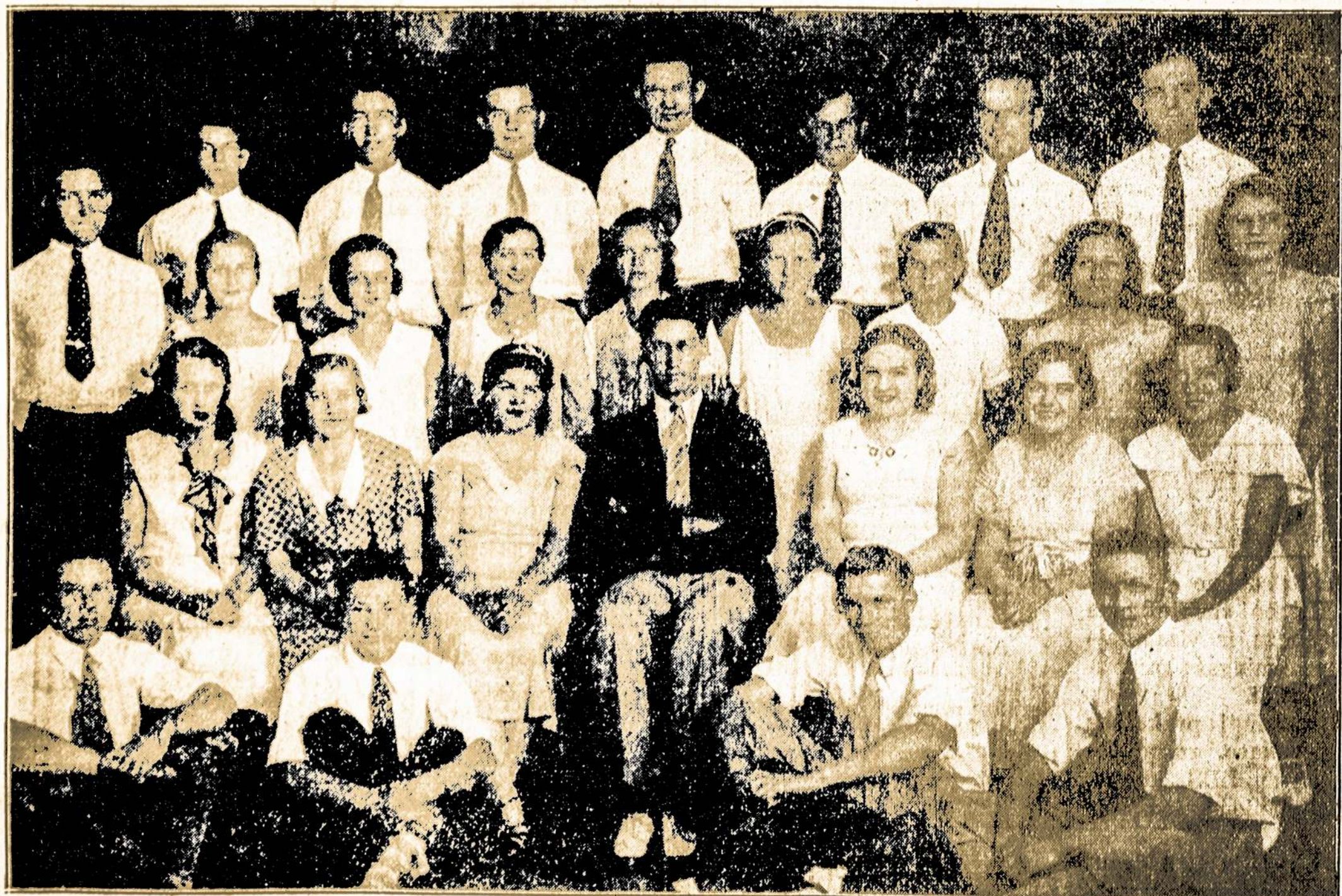
Choras Daina iš New Haven, Conn. Vadovaujamas Latvio

PIKNIKAS PRASIDĖS 11-tą VALANDĄ DIENA. ĮŽANGA 25c. YPATAI