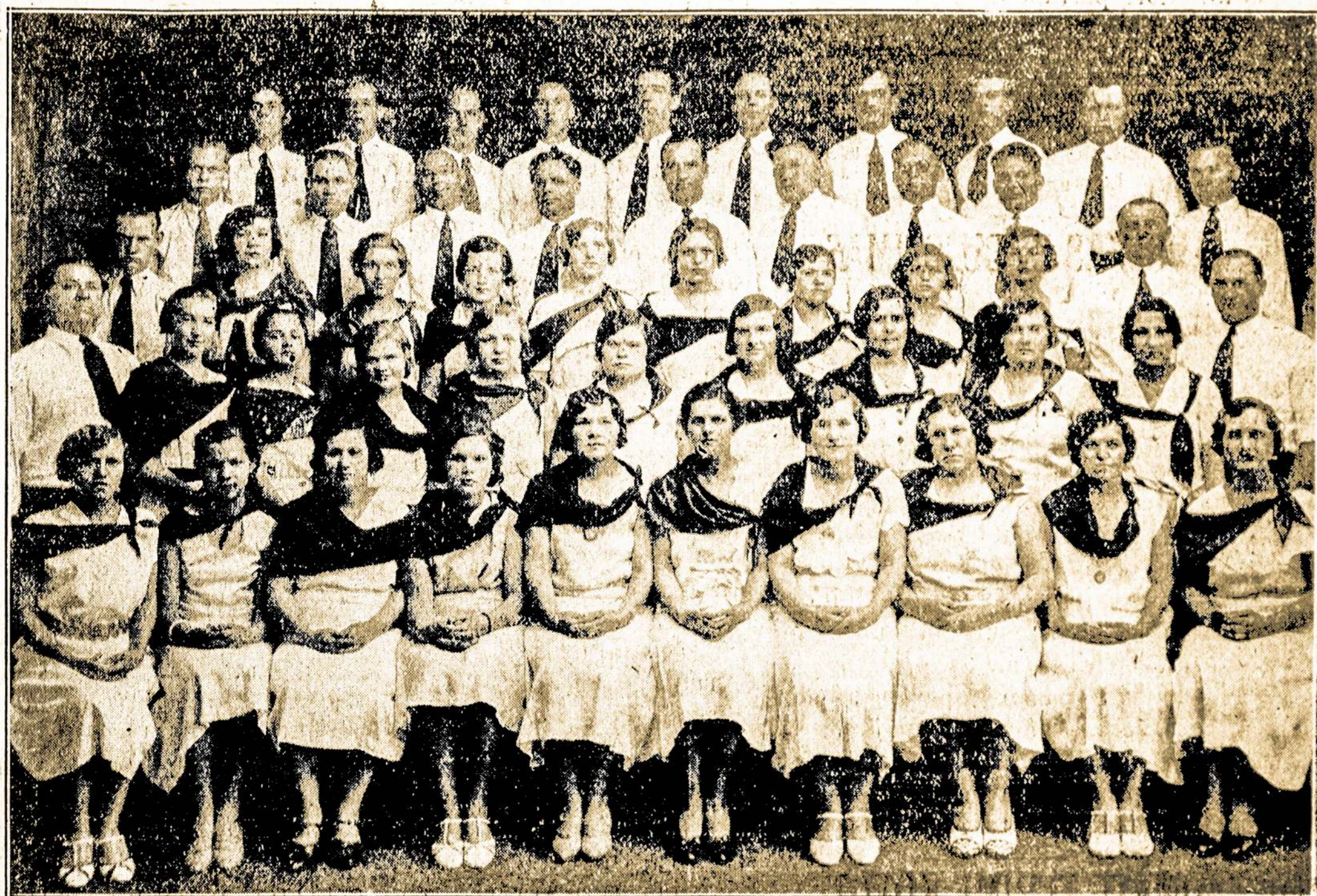
Sietyno Choras iš Newark, N. J., Yra Pakviestas Dainuoti Šiame Piknike