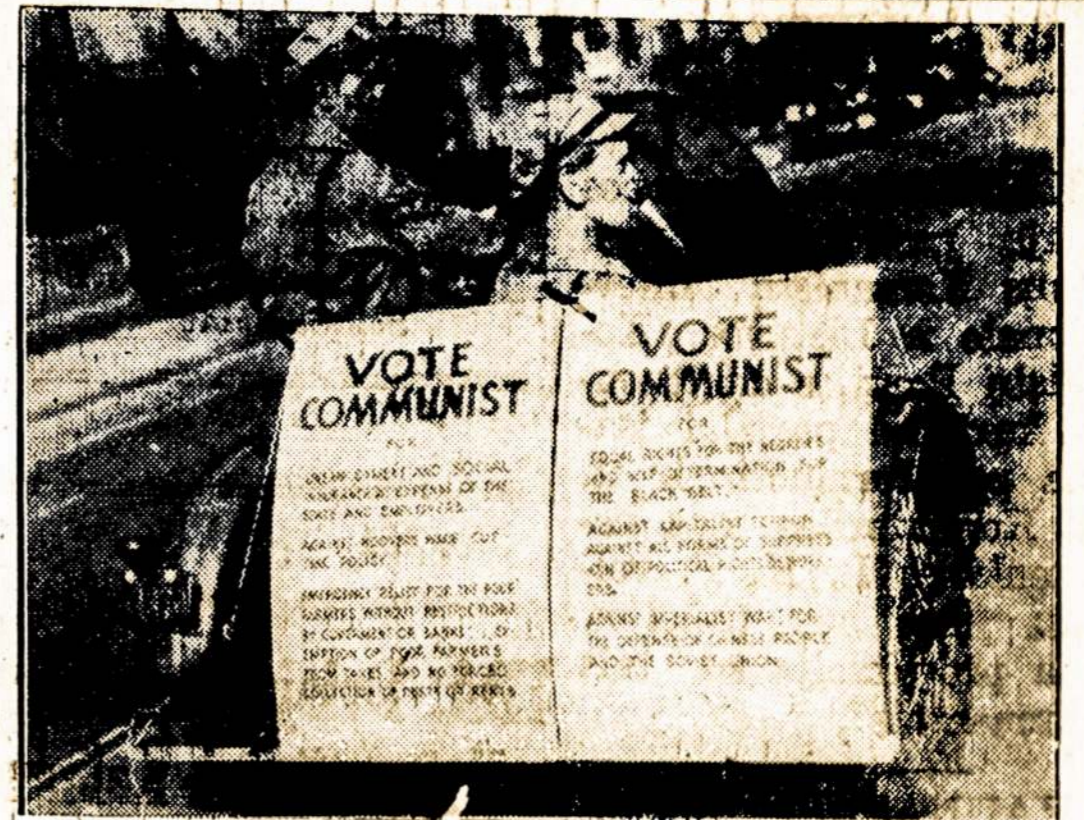
VOTE COMMUNIST! (Balsuokite už komunistus!)—darbininkas ant dviračio užsidedęs Komunistų Partijos platformos vyriausius punktus.