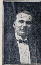
1023 Mt. Vernon Street Philadelphia, Pa.

Įšleisuoja ir laidos omstrimus ant rikių kapinų. Norinteli geroms paravimui ir už šona laika nušildimo vaizdoje šauktis pas mane. Pas mane galite gauti lotus ant viskių kapinų kuo vertingesis vietas ir už šona kalba.