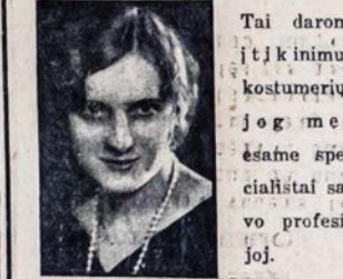
F. KLASTON'S STUDIO 499 GRAND STREET BROOKLYN, N. Y.

Kurie nusitruks savo fotografiją per September mėnesį, tiem duosiu dykai vieną paveikslą dydžio 8x10.