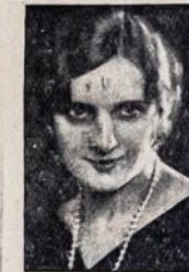
F. KLASTON'S STUDIO 499 GRAND STREET BROOKLYN, N. Y.

Kurie nusitrauks savo fotografiją per September mėnesį, tiem duosiu dykai vieną paveikslą dydžio 8x10.