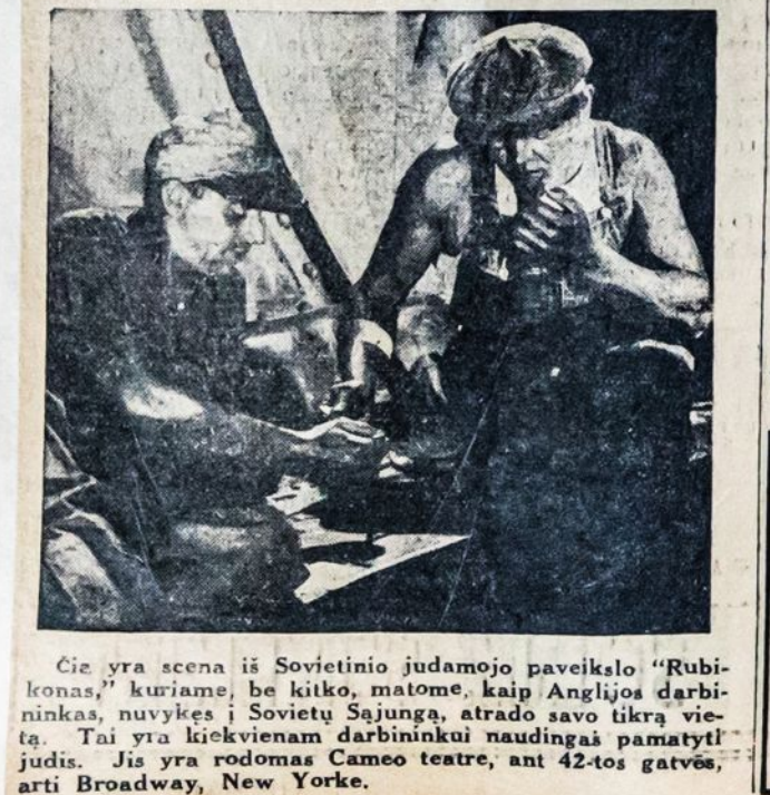
Čia yra scena iš Sovietinio judamojo paveikslą "Rubikonas," kuriame, be kitko, matome, kaip Anglijos darbininkas, nuvykęs į Sovietų Sąjungą, atrado savo tikrą vietą. Tai yra kiekvienam darbininkui naudingas pamatytis judis. Jis yra rodomas Cameo teatre, ant 42-tos gatvės, arti Broadway, New Yorke.