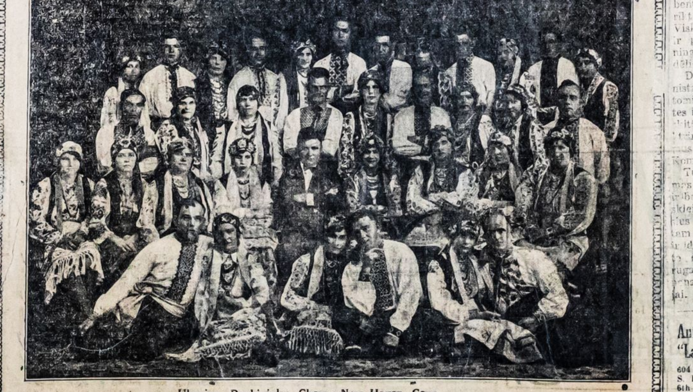
Ukrainų Darbininkų Choras, New Haven, Conn.