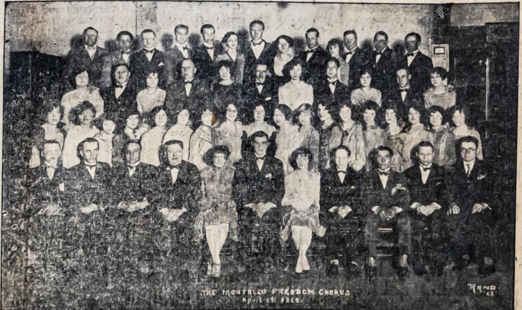
Laisvės Choras, Montello, Mass.

PRASIDĖS 10 VALANDĄ RYTE IR TĖSIS IKI VĖLUMAI