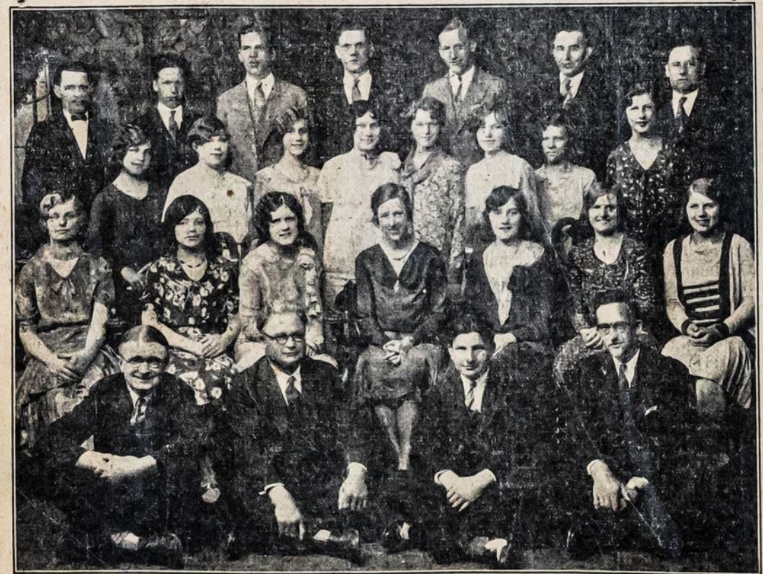
Vilijos Choras, Waterbury, Conn.