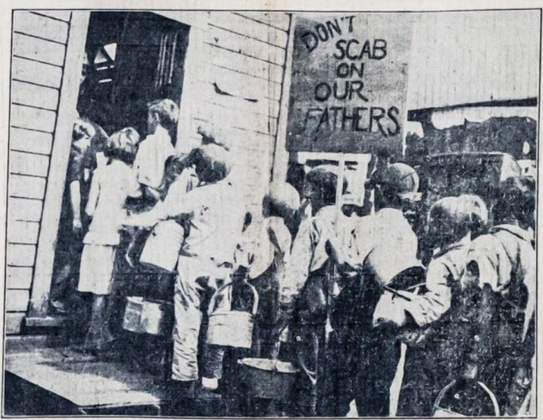
Streikuojančių mainierių vaikai eina į Tarptautinės Darbininkų Pagelbos virtuvę gauti sriubos. Tai vienatinis jų gyvybės palaikymo šaltinis.