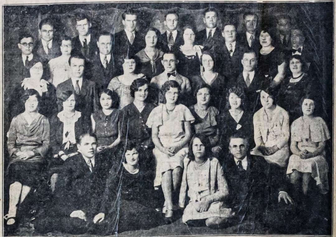
Laisvės Chodas, So. Boston, Mass.

Gerbiame darbininkai ir darbininkės! Jūs privalote būtinai dalyvauti šiame mūsų metiniame piknike, kurį rengia augščiau minėti chorai. Tokį parengimą duodame tik syki į metus, todėl kviečiame dalyvauti ne tik vietinius, bet ir iš toliau. Bus visokių pasilinksminimų (Amusements), kas bus malonu visiems. Sokiams grieš Bert Orris Musical Reviewers, kurie sutraukia milžiniškas minias publikos.