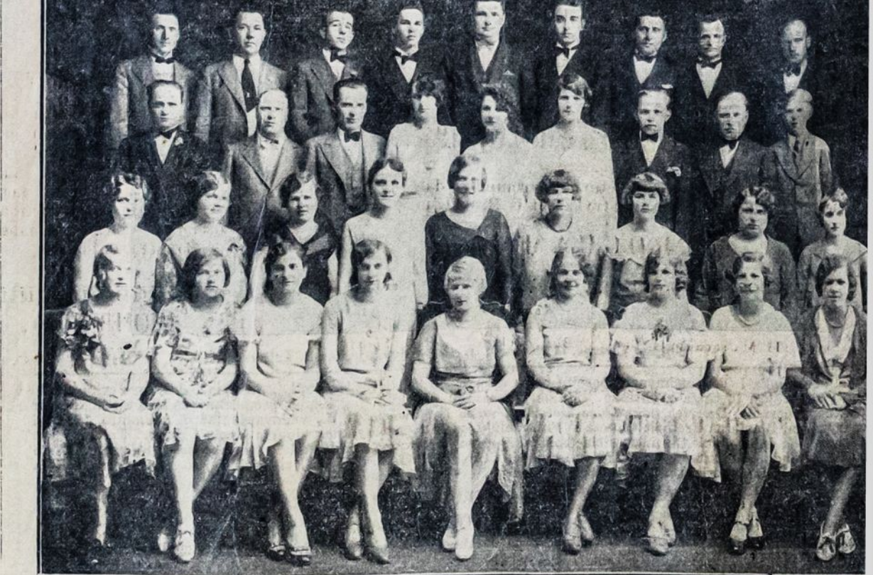
Laisvės Choras, Lawrence, Mass.

Gerbiami darbininkai ir darbininkės! Jūs privalote būtina dalyvauti šiame mūsų metiniame piknike, kurį rengia mūsų tautiško namų parke, Montello, Ma. Bus visokių pasilinksminimų (Amusements), kas bus malonu visiems. Šokiams gies Bert Orris Musical Revue sutraukia milžiniškas minias publikos.