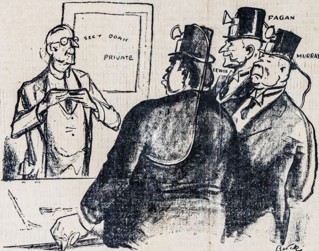
Pardavikiškos Jungtinės Mainierių Unijos pardavikiški Darbininkų Vadai Tariaisi su Deportavimo Sekretorium Apie Kovą Prieš Kovingus Streikuojančius Mainierius.

Rinkimų kampanijai turime suvesti visą energiją ant rinkimų parašų. Masių nepasitenkinimas esama kapitalistine tvarka yra labai didelis. Be-