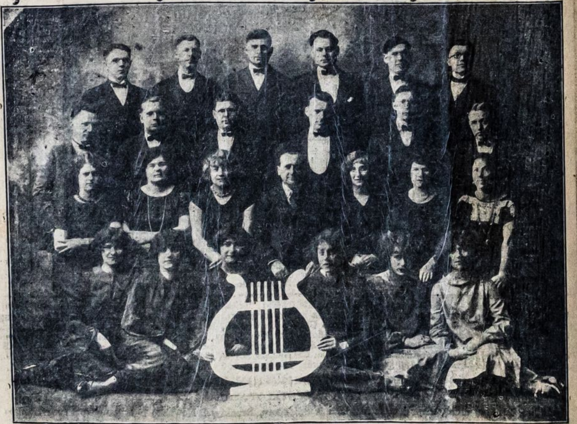
Laisvės Choras, Hav erhill, Mass.

Gerbiami darbininkai ir darbininkės! Jūs privalote būtinai dalyvauti šiame mūsų metiniame piknike, kurį rengia su- čiau minėti chorai. Tokį parengimą duodame tik sykį į metus, todėl kviečiame dalyvauti ne tik vietinius, bet ir iš tolia- Bus visokių pasilinksminių (Amusements), kas bus malonu visiems. Šokiams grieš Bert Orris Musical Reviewers, kur sutraukia milžiniškas minias publikos.