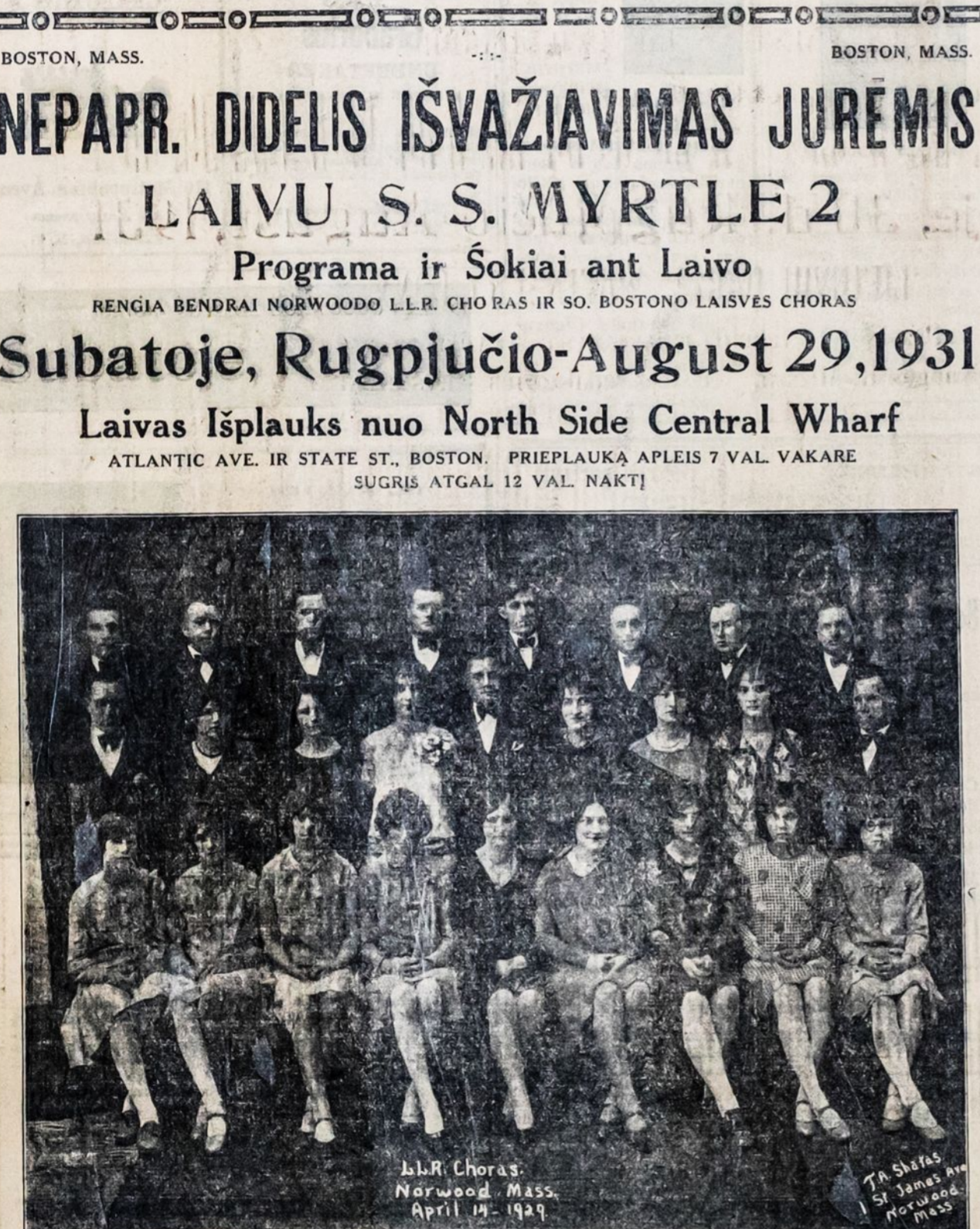
L.L.R. Choras. Norwood, Mass., April 14, 1929.

BOSTON, MASS. NEPAPR. DIDELIS IŠVAŽIAVIMAS JUREMIS LAIVU S. S. MYRTLE 2 Programa ir Šokiai ant Laivo RENGIA BENDRAI NORWOODO L.L.R. CHORAS IR SO. BOSTONO LAISVĖS CHORAS Subatoje, Rugpjūčio-August 29, 1931 Laivas Išplauks nuo North Side Central Wharf ATLANTIC AVE. IR STATE ST., BOSTON. PRIEPLAUKĄ APLEIS 7 VAL. VAKARE SUGRIS ATGAL 12 VAL. NAKTĮ