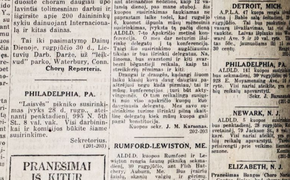
Vilijos Choras, Waterbury, Conn.