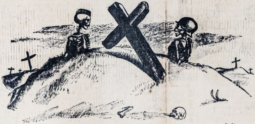
Darbininkai dar neužmiršo pereito imperialistinio karo, o buržuazija jau vėl rengiasi prie naujos skerdynės. Tą baisų pavojų darbininkų klasė nugalės tik tai po vadovybe Komunistų Partijos ir Komunistų Internacionalo.

Darbininkai Visų Šalių. Vienykites! Jus Nieko Nepralaimėsite, Tik Retežius, o Ilaimėsite Pasaulį!