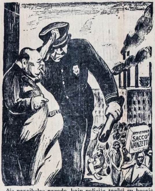
Šis paveikslas parodo, kaip policija tarėsi su bosais ardyti darbininkų demonstracijas už amnestiją politiniams kaliniams rugpjūčio 22 d.

Nuėjo vėjais visi pranašavimai apie gerovės sugrįžimą. Darbininkai turi ruoštis kovoms. Lietuvių darbininkų judėjimas turi būti priruoštas kovoms. Visos mūsų organizacijos turi rengtis užėimui savo vietos tose kovose.