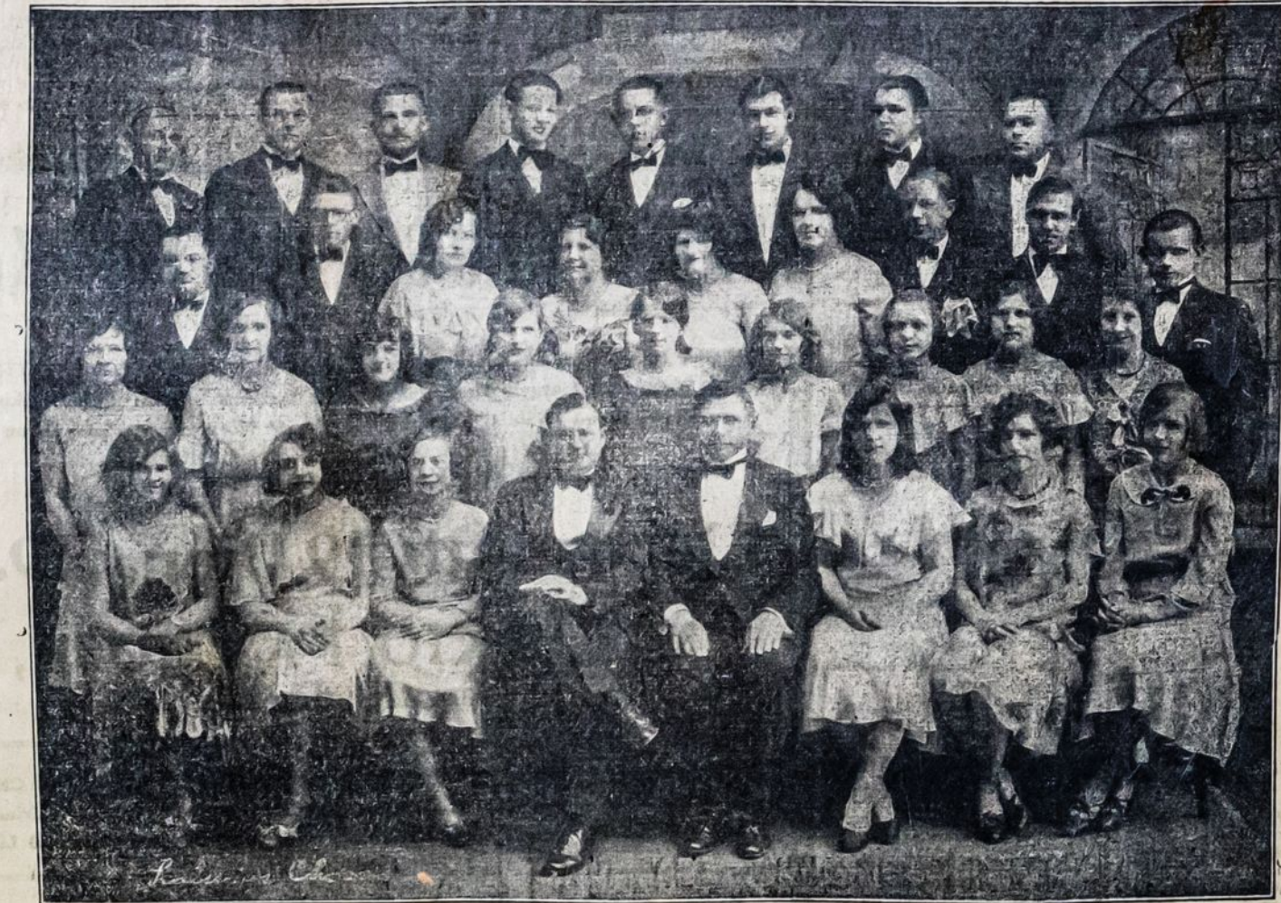
Laisvės Choras, Hartford, Conn.