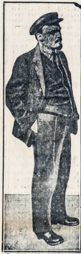
Leninas mirė kaippo ypata, bet nemirs leninizmas niekadosi!