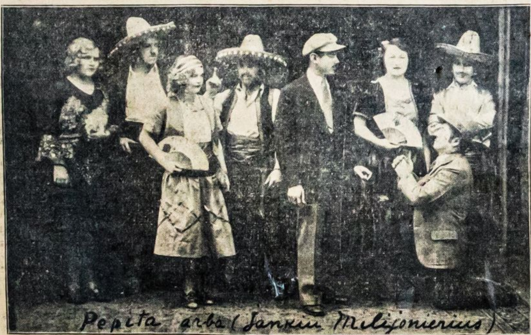
Pepita arba Jankių Milijonierius