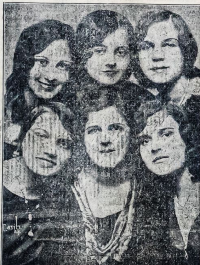
AIDO CHORO MERGINŲ SEKSTETAS

Dabar jis vaidina Grand Operoje, Philadelphiaje, kaip vyriausia figūra, kur darbininkui neprieinama įžanga. "Laisvės" koncerte ir mes turėsime progos jį išgirsti.