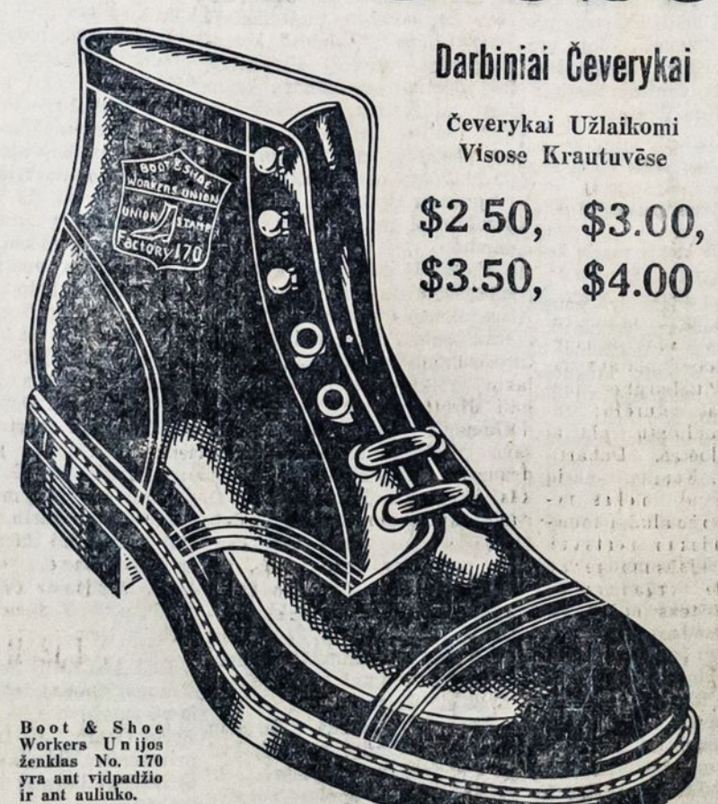
Boot & Shoe Workers Unijos ženklas No. 170 yra ant vidpadžio ir ant auluko.

Jei pas jus krautuvinnikai atsakyty duoti OVER GLOBE čeverykų, tai reikalaukite iš dirbtuvės. Užsakymus prisiuksime per C. O. D. Jei čeverykais nebūsate patenkinti, jums bus sugrąžinti pinigai.