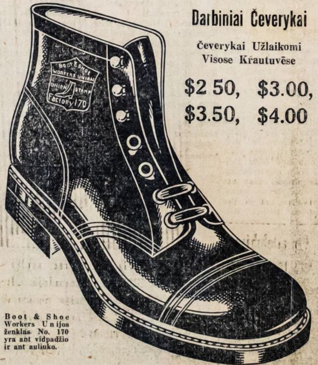
Boot & Shoe Workers Unijos ženklas No. 170 yra ant vidpadžio ir ant auliuko.

Jeį pas jus krautuvinkai atsakytų duoti OVER GLOBE čeverykų, tai reikalaukite iš dirbtuvės. Užsakymus prisiųsime per C. O. D. Jeį čeverykais nebūsute patenkinti, jums bus sugrąžinti pinigai.