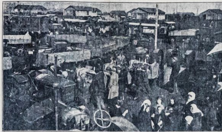
Aikštė Sovietinio Ūkio "Gigantas." Tai milžiniškas ūkis, kuriame gyvena apie 17,000 asmenų. Turi savo dienraštį, teatrą, mokyklą. Jis randasi šiauriniame Kaukaze. Tokių ūkių Sovietų vyriausybė steigia kuodaugiau. Tai tiesiausias kelias į socializmą kaime. (Paveikslas paimtas iš Darbininkų Kalendoriaus 1931 metams.)

J. V. K. P. Lietuvių Centro Biuras. 46 Ten Eyck St., Brooklyn, N. Y. (266-269)