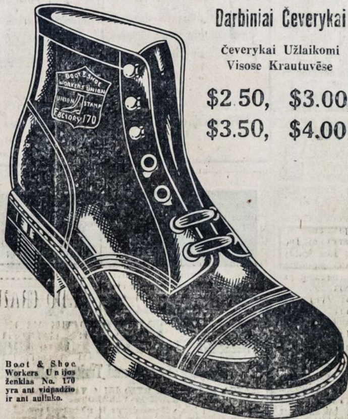
Boot & Shoe Workers Union ženklas No. 170 yra ant vidurinio ir ant auklino.

Jeį pas jus krautuviniškai atsiskaytų duoti OVER GLOBE čevėrykus, tai reikalaukite iš dirbtuvės. Užsakymus prisiųsime per C. O. D. Jeį čevėrykais nebūsėte patenkinti, jums bus sugražinti pinigai.