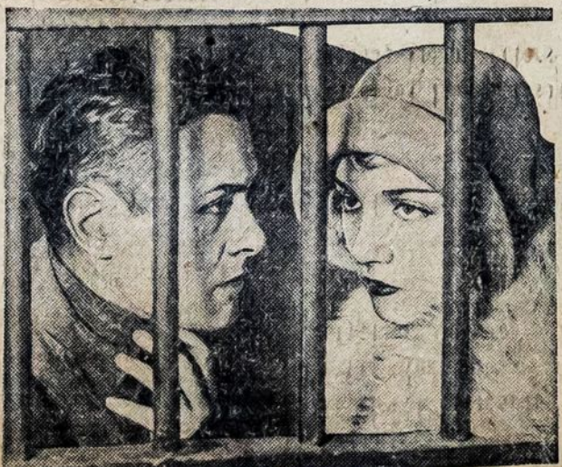
ROBERT MONTGOMERY and LEILA HYAMS in "THE BIG HOUSE"

Praeitą penktadienį Long Island Railroad kompanija atleido nuo darbo 500 darbininkų ant syk. Reikia, prisiartinio prez. Hooverio ir A. D. F. Greeno skelbiami geri laikai ir bedarbės nykimas.