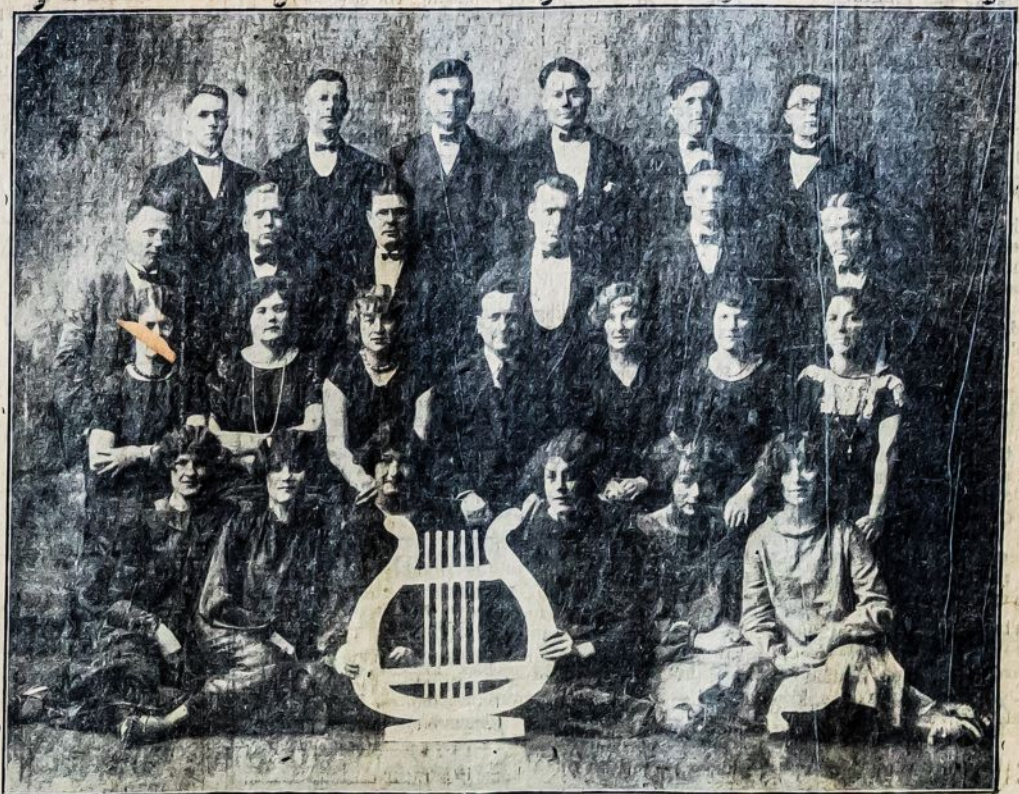
LAISVĖS CHORAS iš Haverhill, Mass.