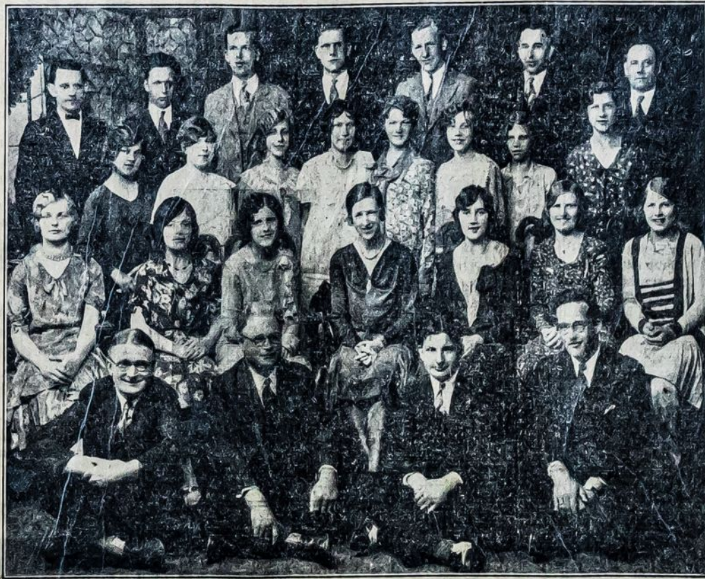
Vilijos Choras, Waterbury, Conn.

Per daugelį metų kankinomės ant saulės, lietaus ir antproblėtos platformos šokdami, šiandien yra pabudavota puiki svetainė del sokių. Grindys pirmos rūšies medžio. Didelė, galima šokti 200 porų. Svetainė pabudavota puikiausioj vietoj, ant kalnelio, prie pat ežero kranto. Iš svetainės žiūrint, pro žaliuojančių medžių šakas, matosi visas ežeras ir mėlynuojantis vandenynas, tai tikrai poetiškas vaizdas. Užkviečiame visus lietuvius Conn. valstijos atsilankyti ir pamatyti svetainę. Taipgi ir visas parkas daug pagerin-tas. Automobiliams daugiaj vietas. Dabar jūs visi draugai pamatę, pasakysite, kad tai gražiausia ir puikiausia vieta piknikams višoj Naujoj Anglijoj.