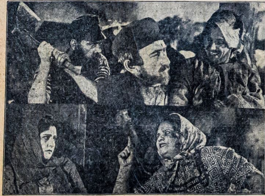
Scena iš tik ką atėjusio iš Sovietų Sąjungos judžio (judamo paveikslo) "Cain & Artem." Šis judis paimtas iš garsaus rašytojo Maximo Gorkio apysakos. Dabar rodomas Cameo Teatre, 42nd St. ir Broadway, New Yorke. Sovietų Sąjungos judžiai nepalyginamai vertesni už amerikinius judžius. Verta pamatyti.