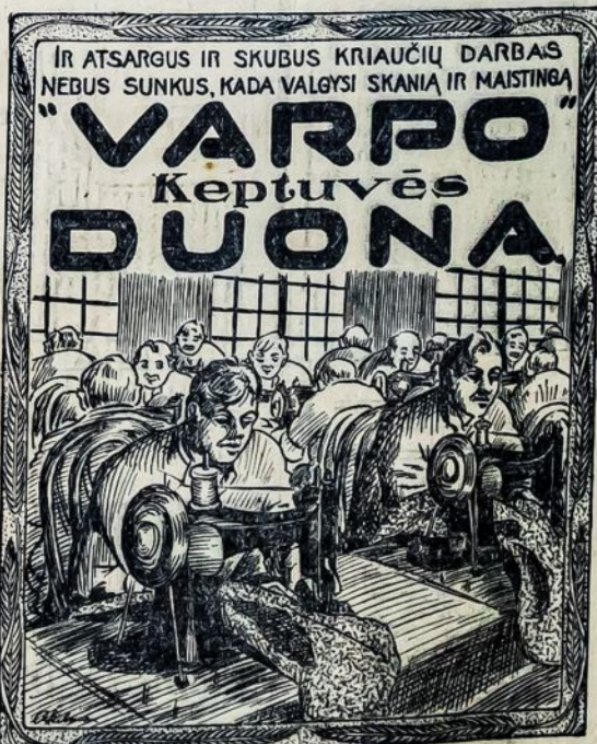
Varpas Bakery, 38-40 Stagg St., Brooklyn, N. Y. Tel., Stagg 5938

Ateityje panašūs dalykai neapsikartos, nes knygy užsakėme arti šimto ir kurie pasimokės, tai bus pasiūsta kartu su kita ekspedicija, kuomet ji bus daroma. Tad jaunuoliai pasirūpinkite iki kitos ekspedicijos, kad visi pasimokėtumėt ir raginkite nepriklausančius jaunuolius prisidėti.