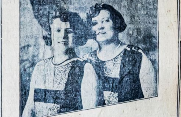
Mūsų garsiosios dainininkės seserys Pauliukoniūtės dainuos šiame piknike

Prasidės 11-tą Ryte ir Trauksis iki Vėlomos