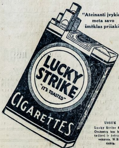
"Ateinanti įvykiai meta savo šmėklas priešakin"

Lucky Strike, puikiausi cigaretai, ko-kius jus kada rukt, pagaminti iš puiki-ausių tabakų Derliaus — "JIE SPRA-GINTI". Lucky Strike turi extra, slaptą šildimo procesą. Visi žino kad šiluma valo ir taip sako 20,679 daktarų kad Luckies mažiau erzina jusų gerklę.