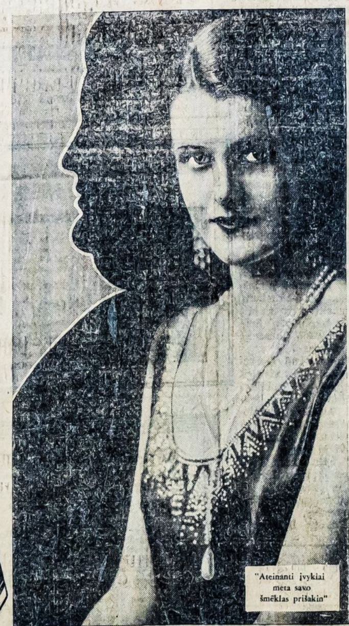
"Atėmanti įvykiai meta savo šmėklas prisikani"

UŽSUK — Lucky Strike Cigarettes Orchestrą kas ketvirtadienį, ir ketvirtadienį vakarais, ir ketvirtadienį vakarais, N.B.C. tinklas.