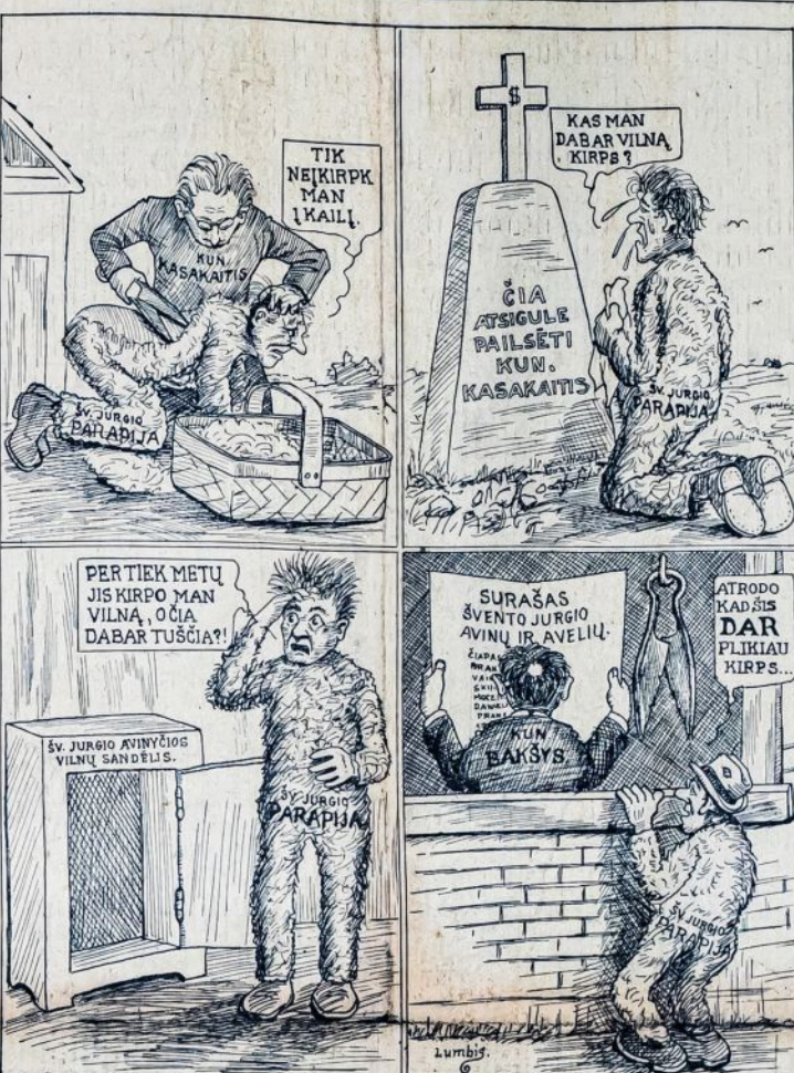
Praeitis, Dabartis ir Ateitis Šv. Jurgio Parapijos, Rochester, N. Y. (Skaitykite korespondenciją iš Rochesterio).

Panevėžio miesto valdyba davusi bedarbiams 3—4 d. dirbti nuo bal. 17 d. visus juos atleido, pranešdama, kad darbo nebėra. Pasiliko tik apie 60 žmonių, kurie dirbs visą savaitę.