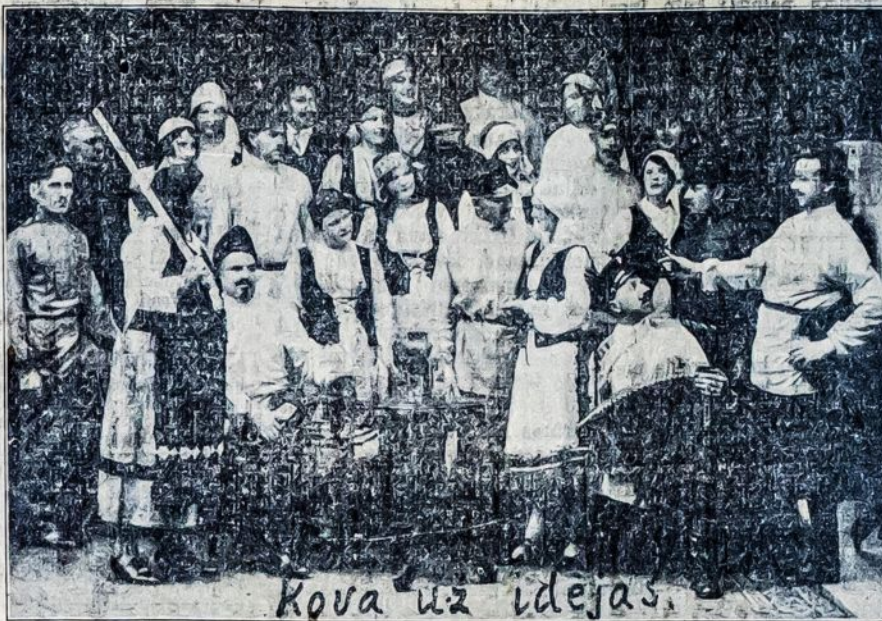
Kova už idejas.

407 Lafayette St., Bridgeport, Conn. Darys atsidarys 6:30 P. M. Programa prasidės 7:30 P. M.