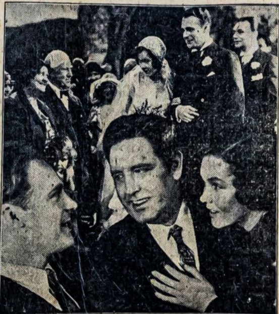
Scenos iš "Song O' My Heart" (Mano Širdies Daina), Fox Movietone veikalo, kur dainuoja John McCormack, garsus airių tenoras, 44th St. teatre, vakarinėj pusėj nuo Broadway, New Yorke.