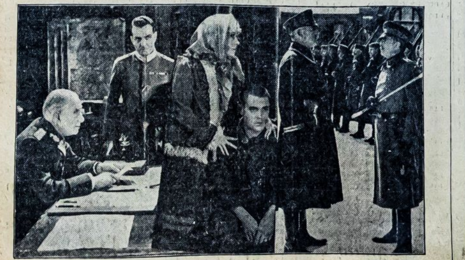
Scena iš pagarsėjusio veikalų "The Case of Sergeant Grischa" (Puskarininko Grischo Dalykas), kuris dabar rodomas Cameo teatre, 42nd St. ir Broadway, New Yorke.