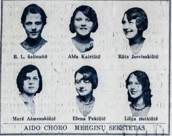
AIDO CHORO MERGINŲ SEKSTETAS