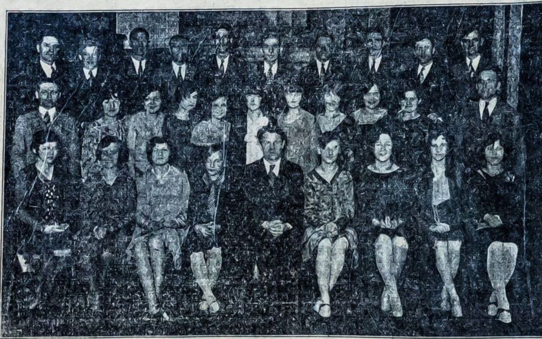
Patersono Laisvės Choras

Šeštadienyj, 22 d. Kovo (March), Pradedant 8-tą Val. Vakare, Sharp WASHINGTON HALL (LENKŲ NAME), 74 GODWIN STREET, PATERSON, N. J.