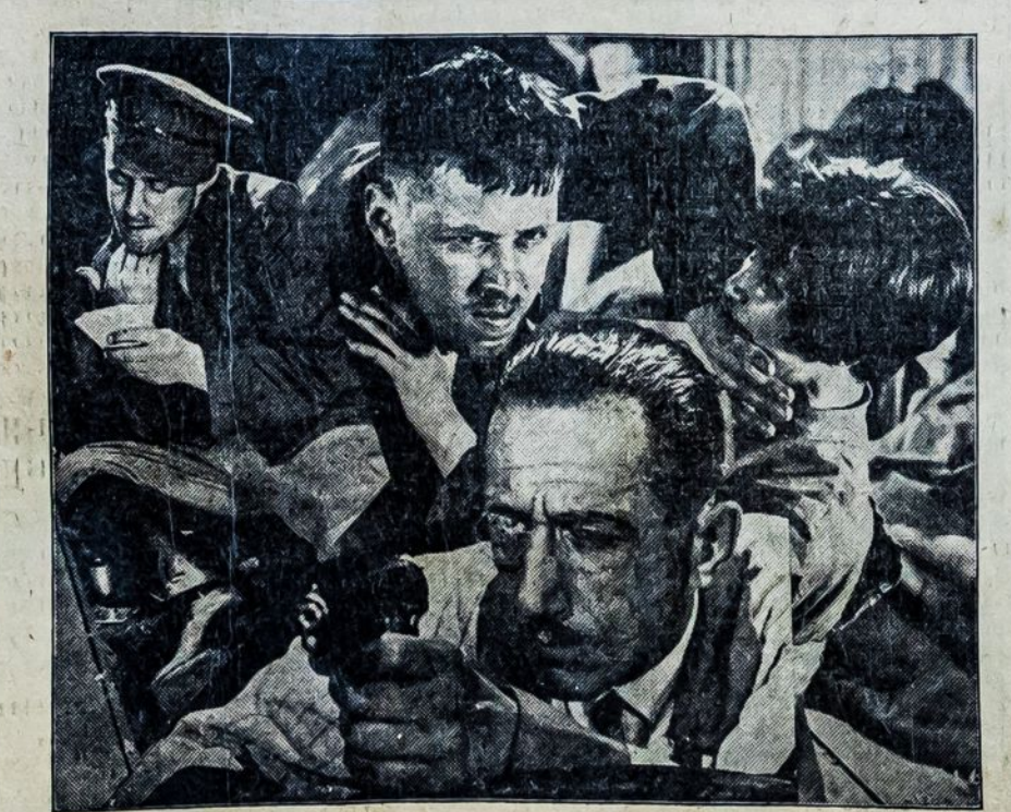
Scenos iš "Chinijos Ekspreso," naujausio Sovietinio judžio, kuris rodomas dabar Cameo Theatre, 42nd St., ties Broadway, New York'e.

kys kapitalizmo sistema. Taigi kova prieš bedarbę tuo pačiu žygiu yra ir kova prieš kapitalizmą ir prieš imperialistinius karus, su kurių pagalba imperialistai stengiasi išsivaduoti nuo naminių krizių; bet ir po to seka dar didesni kriziai, ką matome po pereito pasaulinio karo.