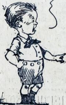
Who said that the Pioneers weren't going over the top in the membership drive!

APPLE SAUCE! HOW DO YOU OLD FOGIES GET THAT WAY?